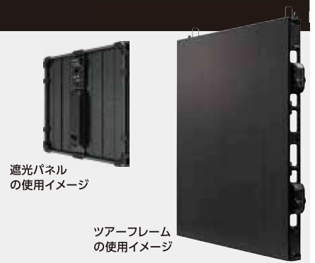
遮光パネルの使用イメージ

ツアーフレームの使用により、吊り設置から据え置き設置まで、環境に合わせた様々な仕様に対応。