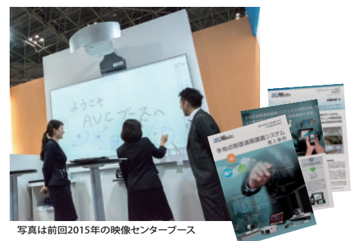
写真は前回2015年の映像センターブース

また、映像センターブースでは、導入実績リーフレットを配布しております。システム導入までの経緯、活用例、将来への運用展開など、導入ご担当者のお話なども掲載された導入事例リーフレットをぜひご覧ください！