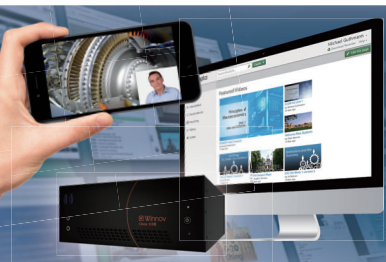
動画・収録/配信ソリューション

ミーティングボードの機能を効果的に活用した実演式のグループワークを開催。注目のワークショップ!