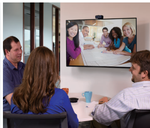
最新のクラウド会議サービス