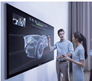
オールインワン Meeting ボード