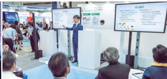
詳細スケジュールは後日WEBにてご案内