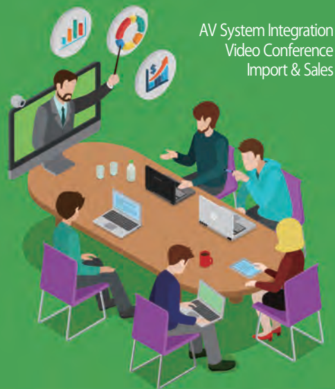
AV System Integration Video Conference Import & Sales